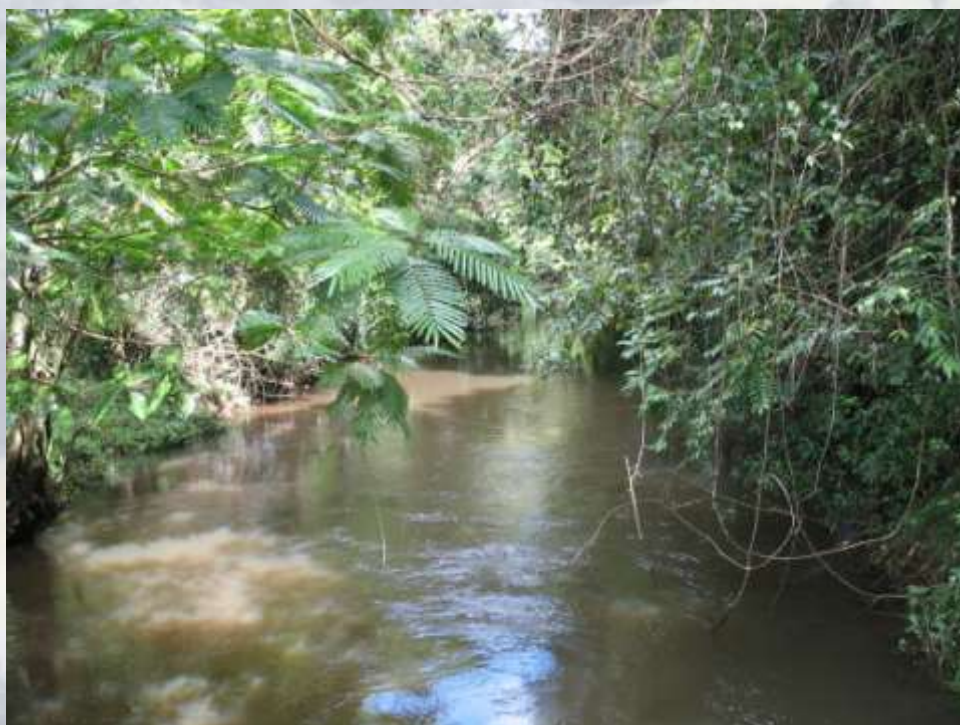
Rio Copalchi bij ons "bos".