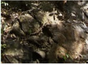
Inspectie is best moeilijk