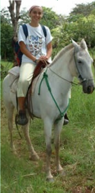
Inspecties gaan te paard