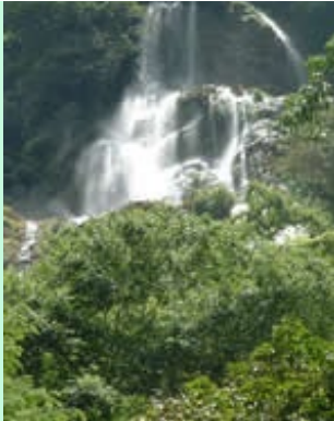
Waterval in het regenseizoen