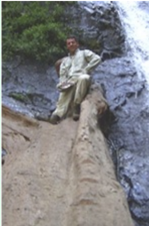
Dit moet je voelen!