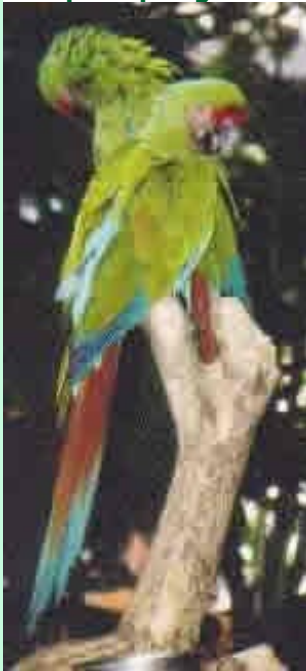
Doelsoort is de groene ara