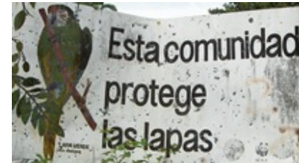
Ook het WWF helpt mee

We krijgen vaak de vraag of ons initiatief nieuw is. Ja, het is nieuw dat mensen zelf een stukje regenwoud ook daadwerkelijk beschermen. Nee, het is niet nieuw dat buitenlandse mensen in Costa Rica een Nationaal Park opzetten. Ruim 40 jaar geleden werd Nationaal Park Cabo Blanco beschermd, door buitenlanders. Ook Nationaal Park Curu werd door buitenlanders opgezet en zo zijn er nog vele andere voorbeelden. We werken op een vertrouwde manier - we bieden mensen wél meer waar voor hun geld. Lees hier meer over Cabo Blanco en andere nationale parken in Costa Rica >>