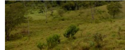
Chachalaca ons volgende doel