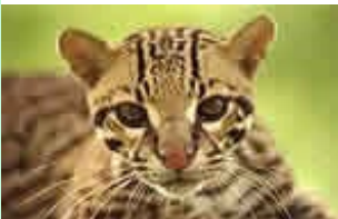
Ocelot of manigordo