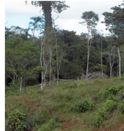
Copalchi begin bos