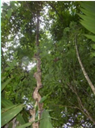
Lianen in het Copalchi oerwoud

Lianen zijn zeer kwetsbaar voor ingrepen in het bos. Als jagers, goudzoekers of zelfs toeristen alleen maar door een bos lopen, zijn het vaak de lianen die door hun kapmessen beschadigd worden. Soms omdat ze in de weg zitten, maar ook omdat veel lianen prima drinkwater leveren. Vanuit de wortels wordt het water naar boven gepompt. Het water komt uit de grond en is