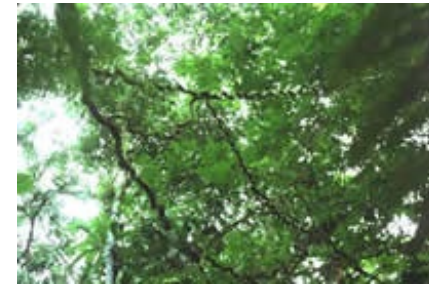
Lianen in het bos