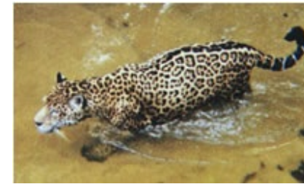
Een jaguar op pad zwemt ook om een barrière te nemen

Jaguars leven solitair en leggen vaak enorme afstanden af om een paringspartner te vinden. Ze verplaatsen zich 's nachts. De meeste mensen zien ze dus nooit. Indianen legendes vertellen dat hun jagers eigenlijk jaguars waren en als ze terug kwamen uit de jungle hun gespikkelde huid weer aflegden.