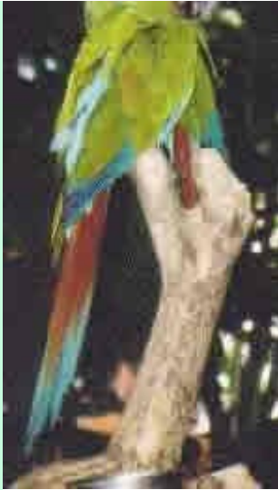
Lapa Verdes, de groene Ara is er natuurlijk ook

het gebied van MVO. Emanuel zal zich de komende maanden inwerken in zijn nieuwe taak bij Oasebos en dan op termijn deze functie van Hylke overnemen.