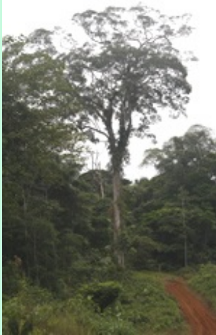
Ingang El Cerrito

Hierboven twee links naar stukjes van de video van CCT. Klik op de foto en de video opent in een apart scherm