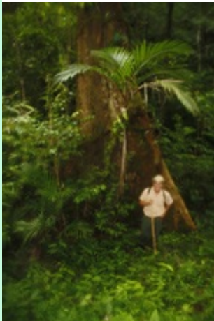
De mens is maar klein bij zo'n woudreus