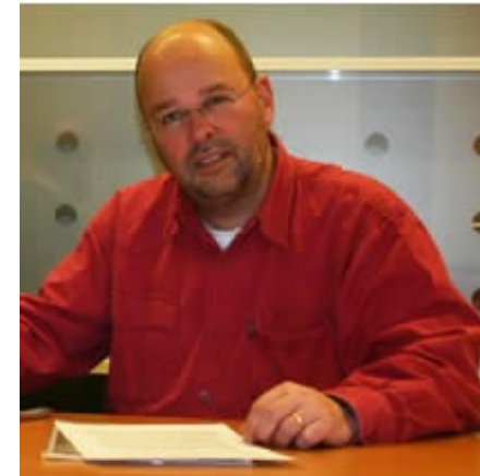
Michiel Goofers van Westerprojekt Consultancy sponsort Oasebos per verkocht product. Lees hier verder...

In november 2010 heeft Stichting Oasebos een Google Grant toegewezen gekregen voor gratis adverteren op Google AdWords . De advertenties van Oasebos worden naast relevante zoekresultaten op Google weergegeven, en als mensen erop klikken, worden ze naar de startpagina van Oasebos geleid. Dankzij de Google Grant kan Oasebos haar boodschap over natuurbescherming onder een groot publiek verspreiden, en zo participanten en donateurs werven, informeren en bij haar activiteiten betrekken.